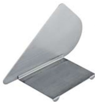
TB 2-BS divider