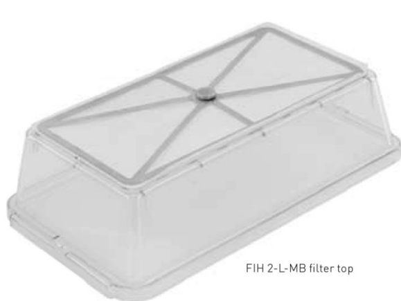
FIH 2-L-MB filter top