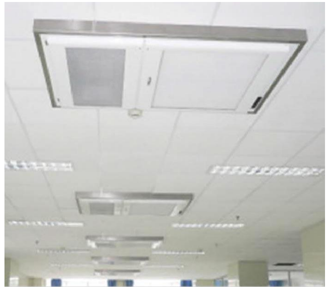
Размещение на потолке